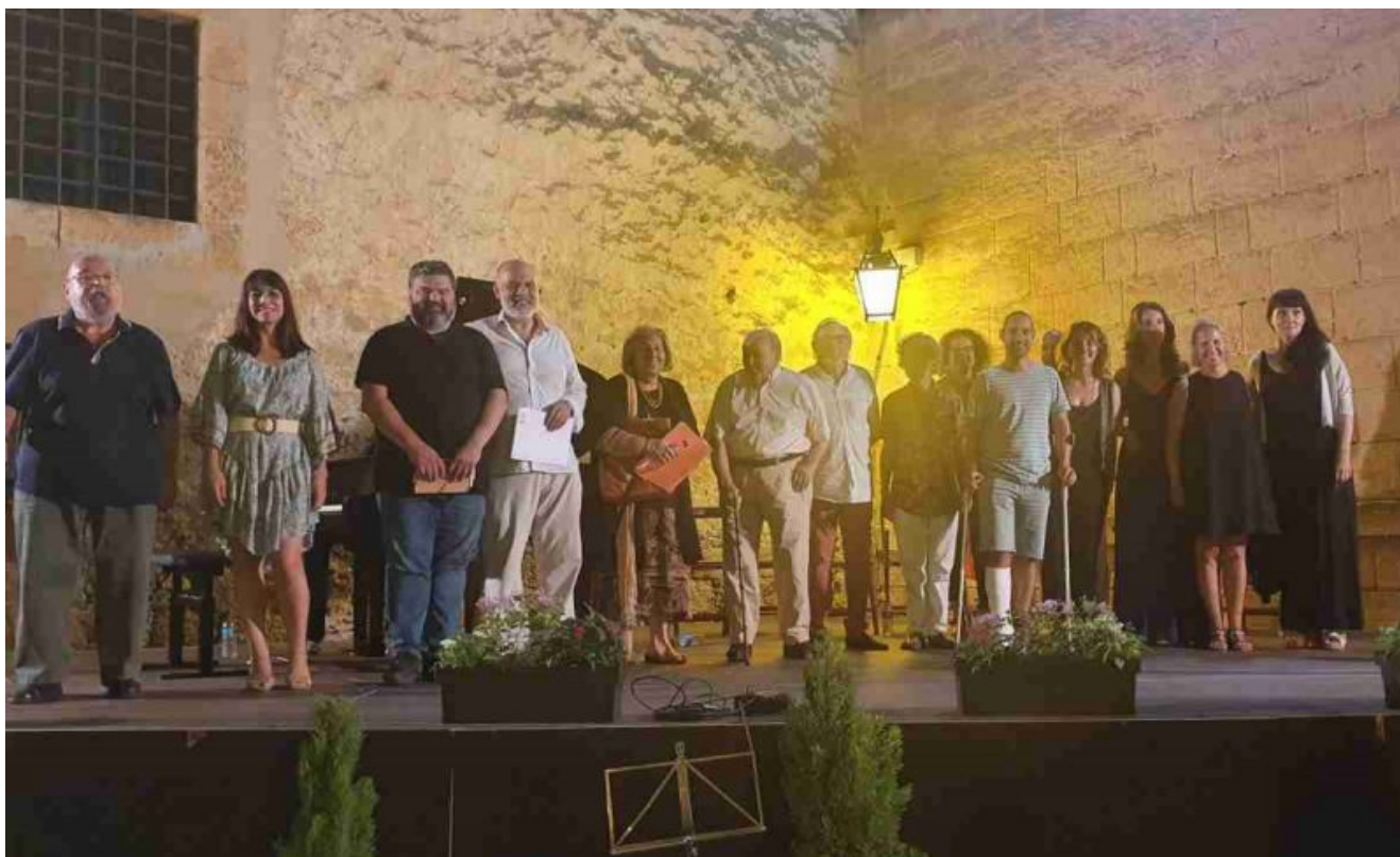
Foto de tots els/les participants a l'acte d'aquest diumenge.