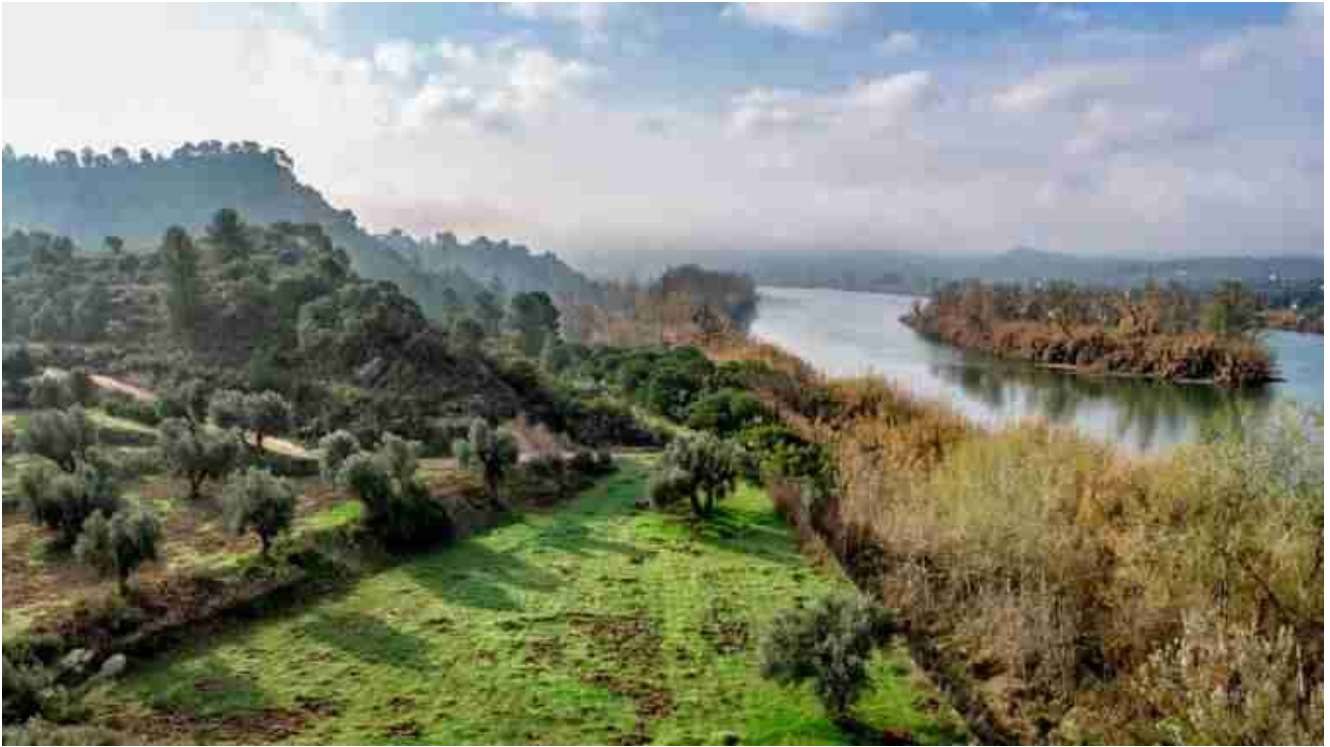
L'Ebre, al seu pas per la Ribera.