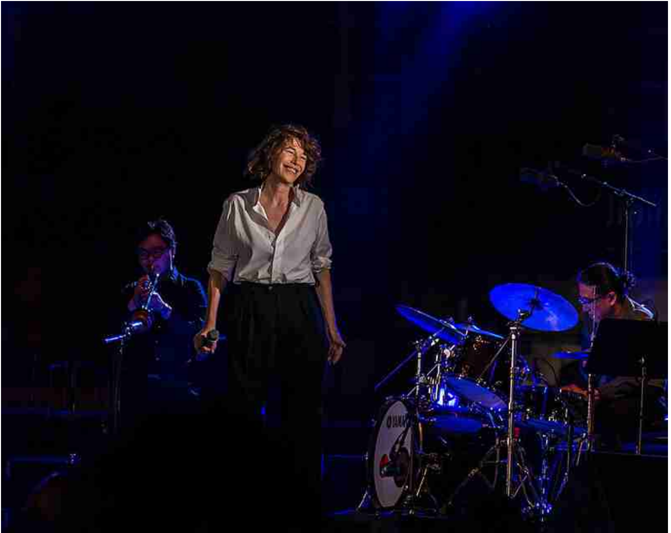
Birkin en un concert a Carcassonne, fa pcs anys.

A més de la seva faceta musical, Jane Birkin va deixar la seva empremta al cinema amb més de cent pel·lícules. Va treballar amb reconeguts directors com Antonioni, Godard i Alain Resnais, encara que mai va arribar a rodar obres mestres del setè art. Tot i així, la seva presència a la pantalla captivava el públic amb el seu encant i sinceritat.