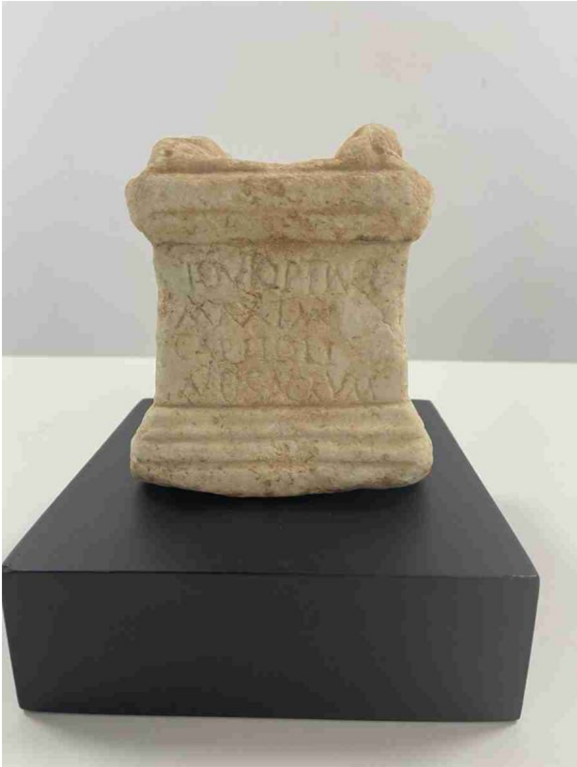
Imatge de la peça robada.

Les investigacions van començar a mitjan any 2015, quan els agents van tenir coneixement, a través de l'Arma de Carrabinieri d'Itàlia, de la possible localització de la peça. Les autoritats italianes van informar que la peça figurava com a venuda en una casa de subhastes en línia als Estats Units.