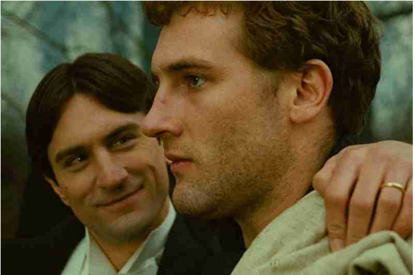
Fragment del film amb De Niro i Depardieu.

No cal parlar massa de la música. Simplement, Ennio Morricone va compondre una obra mestra que acompanya i completa una altra obra mestra. Els violins porten l'acció i uneixen espectador i personatges de la pel·lícula, sobretot en l'escena final. A més, la banda sonora és la prèvia de "Cinema Paradiso" i d'altres obres, perquè hi ha melodies, sobretot les primeres notes, que s'assemblen molt a la música que compondria gairebé deu anys després. De fet, en aquest film es reconeix fàcilment la marca personal del compositor que més tard deixarà empremta a moltes altres pel·lícules.