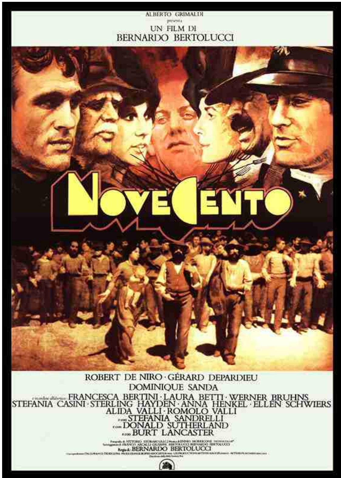
Cartell oficial de la pel·licula.

Les seves gairebé cinc hores de durada expliquen la història al voltant de Olmo i Alfredo. El primer, fill d'un pagès, el segon, fill del patró. Els dos neixen l'any 1900 i fan front a les nombroses dificultats que presenta aquest segle, però cadascú des del seu punt de vista. És a dir, Olmo sent pagès