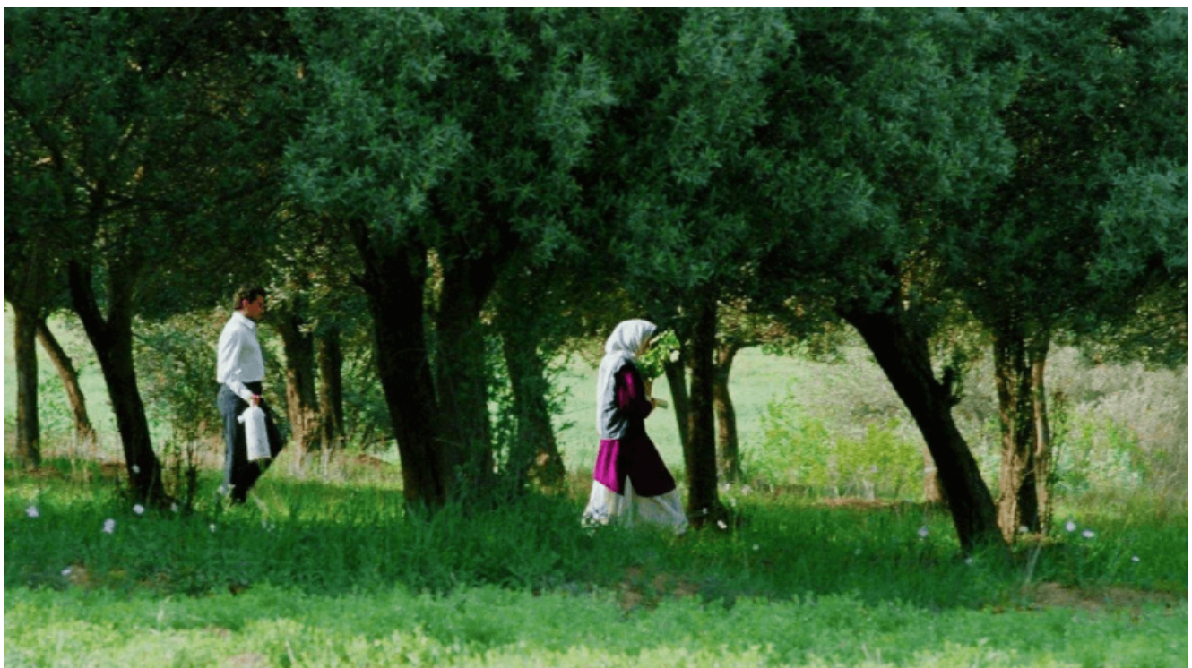
Fragment de "A través de los olivos"

Així, Kiarostami adopta la teoria cinematogràfica realista per incorporar-hi l'autoconsciència sobre el món. “El cinema ha de baixar cap a un món material per presentar la vida tal i com és” i en la trilogia de Koker aquest concepte està molt ben aplicat. L'humanisme i la naturalitat tant de les històries com dels personatges travessa la pantalla per plantejar una representació del món que coincideix amb la vida mateixa.