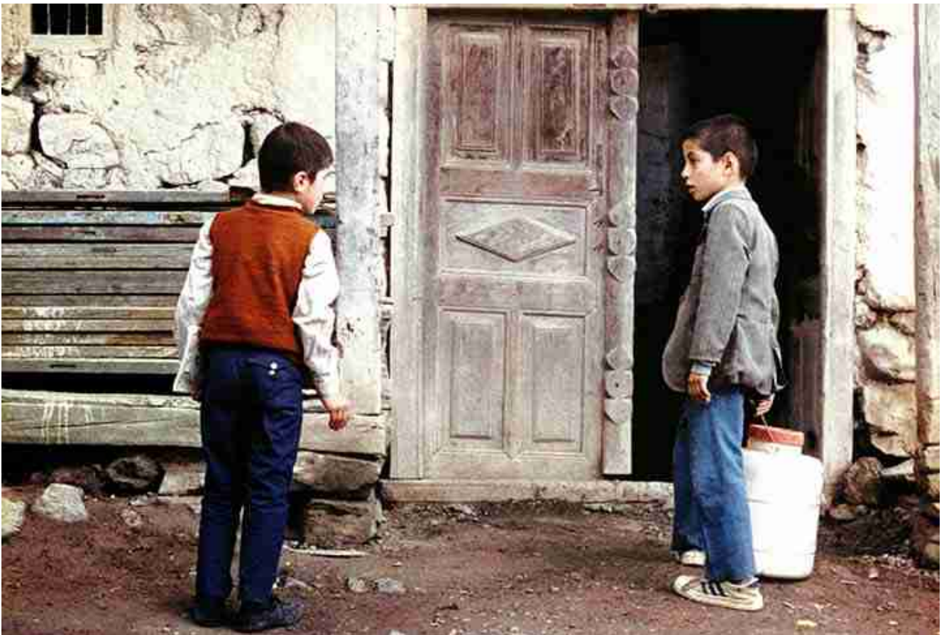
Fragment de " ¿Dónde está la casa de mi amigo? "

Amb l'estrena de " ¿Dónde está la casa de mi amigo? " es recupera el realisme que Bazin havia defensat anys enrere i es contraposa amb el cinema comercial que apostava pels efectes especials. Kiarostami demostra que la teoria baziniana és aplicable i funciona dotant a la càmera d'un poder que va més enllà de la còpia del món. Aquest film es conforma com una representació explícita del cinema que Bazin defensava i en el que inicia una reformulació d'aquest.