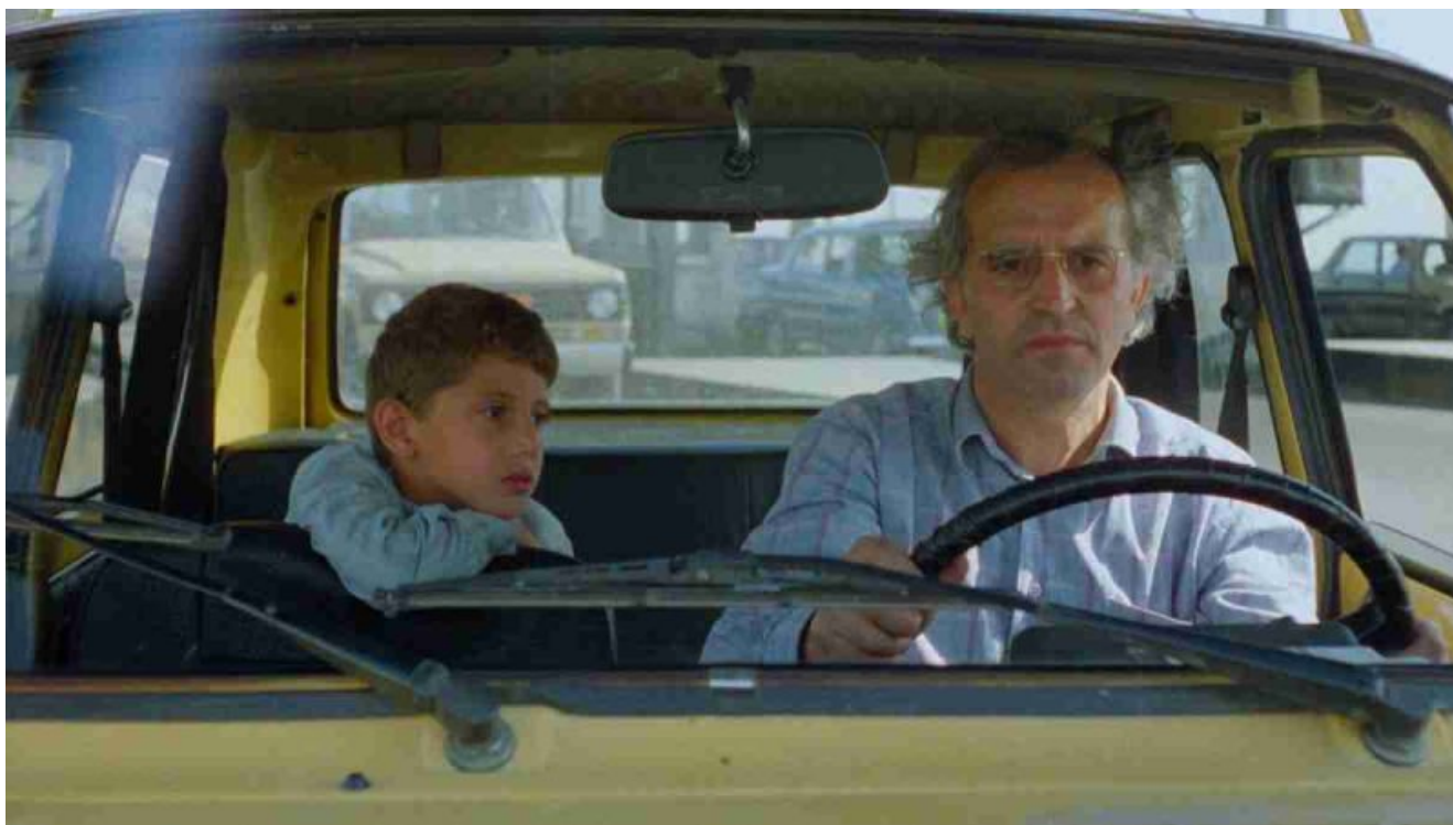
Fragment de "Y la vida continua"

El mite del cinema-total s'ha quedat enrere. Deixant de banda les possibilitats tecnològiques que hi ha avui en dia per representar la realitat, Kiarostami trenca el mite i en crea un de nou. El seu estil es podria definir amb el concepte de cinema-realitat, perquè aconsegueix la seva màxima representació.